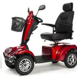
CARPO 2 SE / XD SE