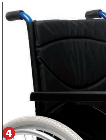
Freins avec poignées longues et rabattables