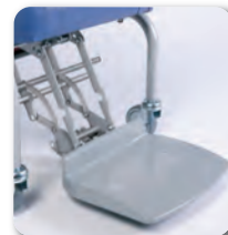
Palette repose-pieds avec roulettes - B10