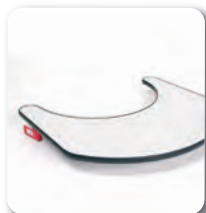
Tablette - B12