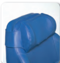
Appui-tête - B55