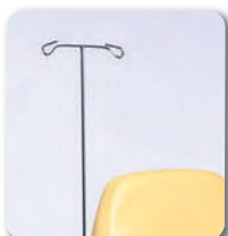
Porte serum - B52