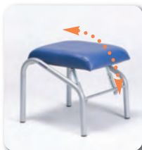
Pouf inclinable 500 x 500 x 450 mm (LxLxH)