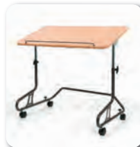
Table 378 disponible