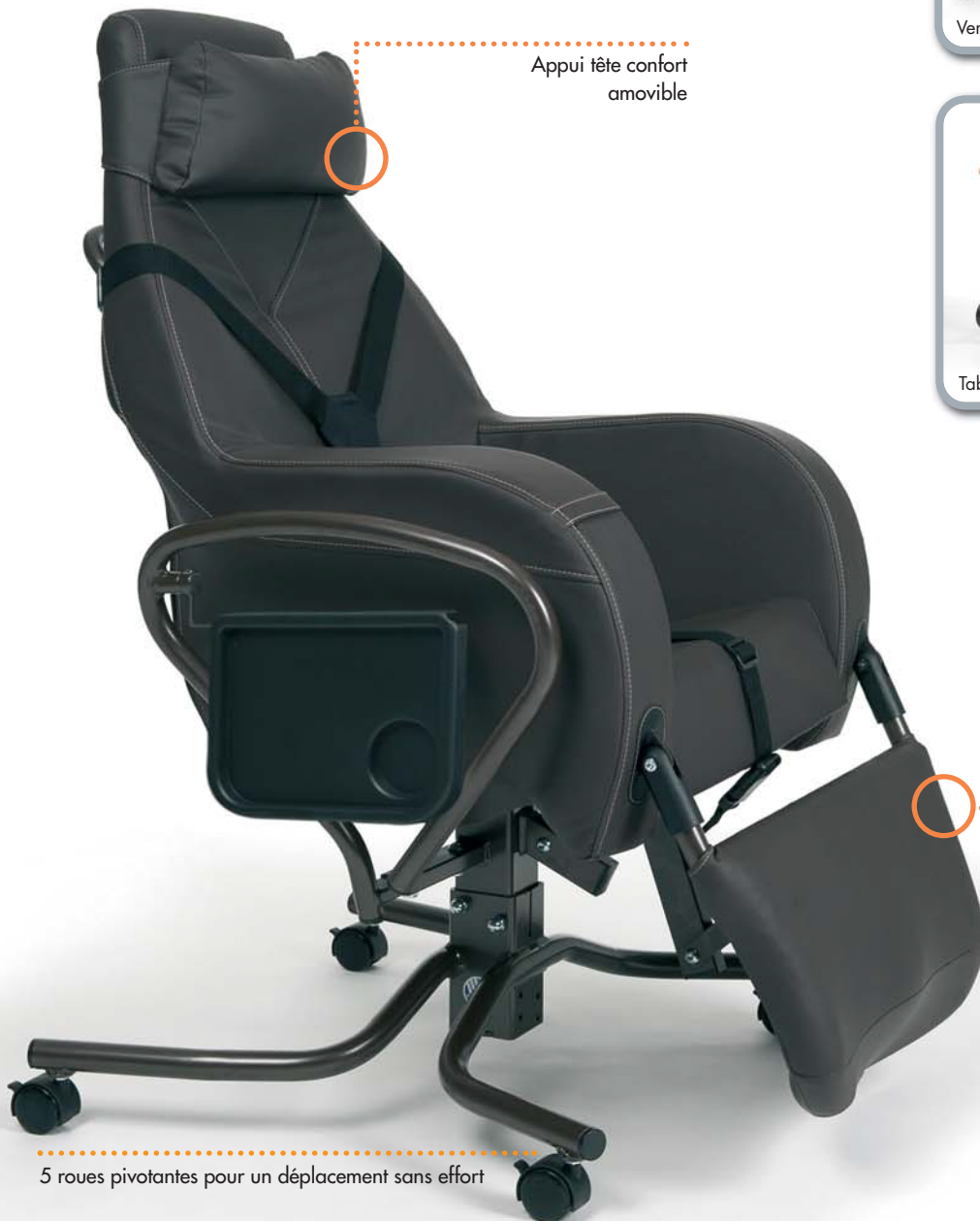
Appui tête confort amovible