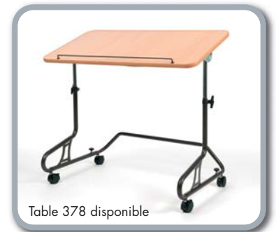
Table 378 disponible